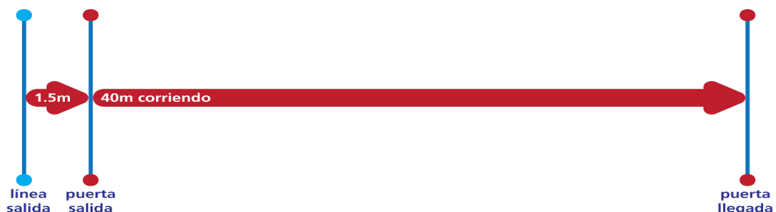
Gráfico de la prueba:

Si un árbitro falla en una de las seis carreras superando el tiempo máximo establecido, dispondrá de una carrera más, inmediatamente tras concluir la serie de seis. Si supera el tiempo máximo establecido en dos intentos, el árbitro no superará la prueba.