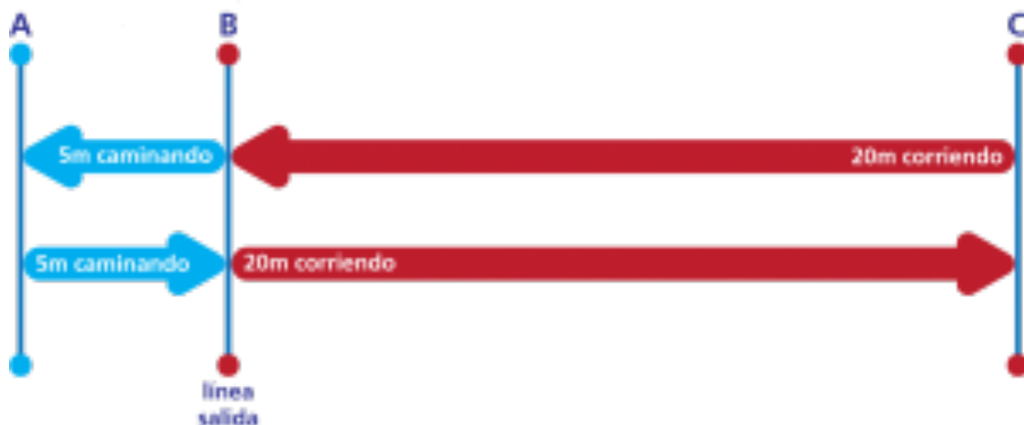
Gráfico de la prueba Yo-Yo intermitente:

Los árbitros deben comenzar desde una posición de pie, con el pie delantero sobre la línea (B). Los árbitros deben obligatoriamente pisar la línea de cambio de dirección (C). Si un árbitro no pisa la línea de cambio de dirección (C) o no realiza el recorrido completo (B-C-B-A-B) quedará eliminado de la prueba. Si un árbitro no regresa claramente a la línea (B) a tiempo, deberá recibir un aviso claro del responsable de la prueba. Si esto ocurre por segunda vez, el responsable de la prueba de indicará que debe abandonar y no habrá superado la prueba.