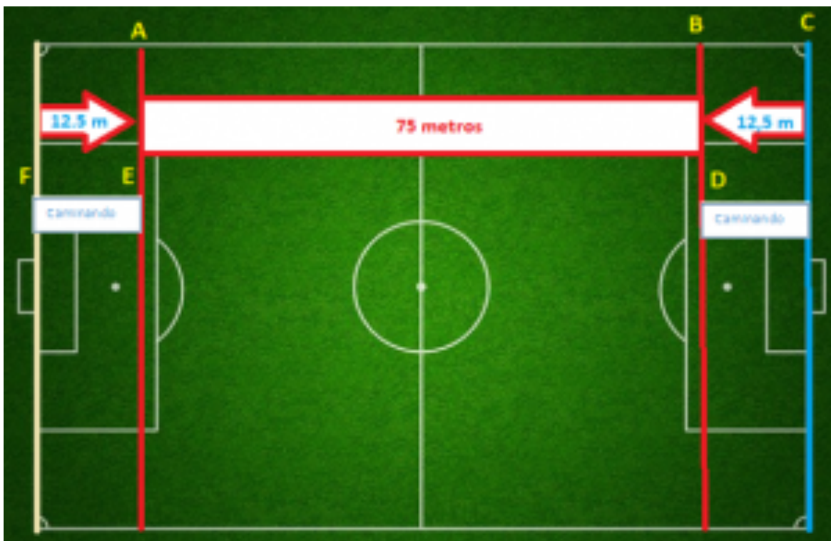
Gráfico de la prueba en terreno de juego o superficie similar: