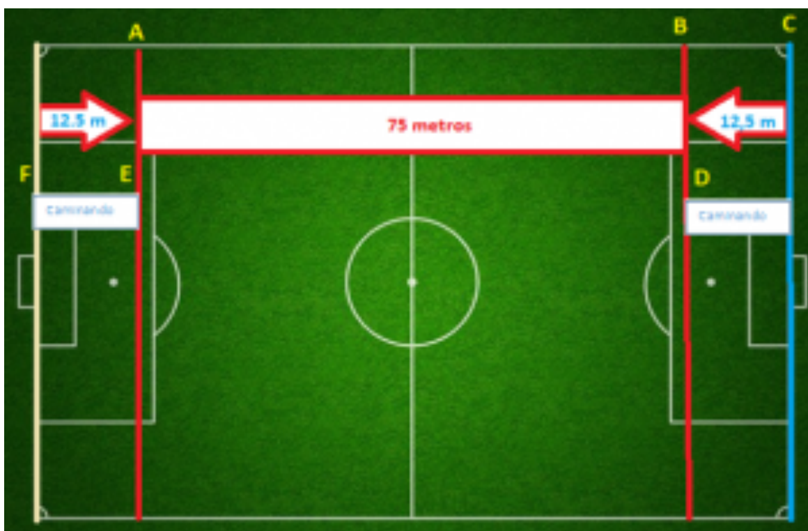
Gráfico de la prueba en terreno de juego o superficie similar: